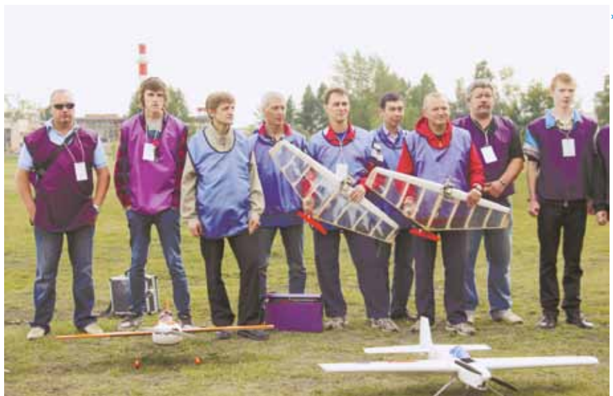
«В 70-летие Кольцово мы проведем еще более масштабное шоу»

19 августа на стадионе ДОО «Авиароботников» состоялось авиамodelьное шоу