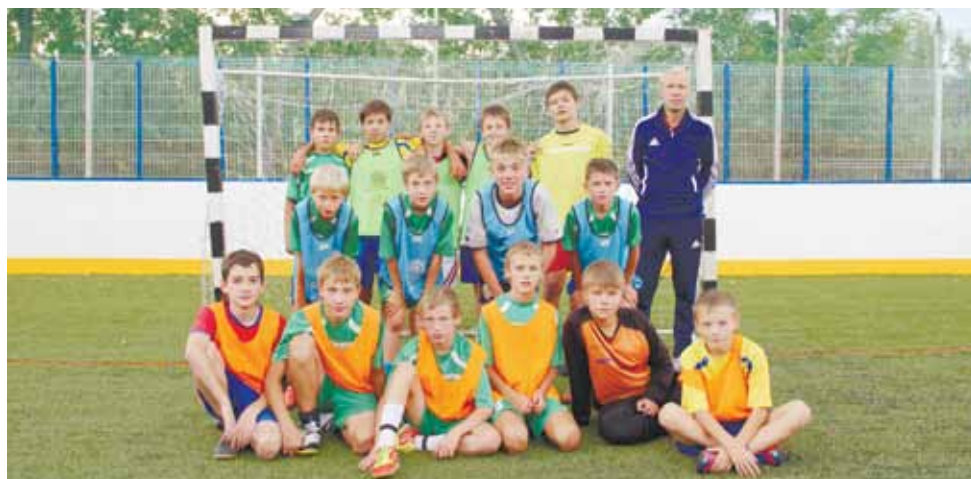
В Испании эта команда будет защищать честь Октябрьского района, честь России