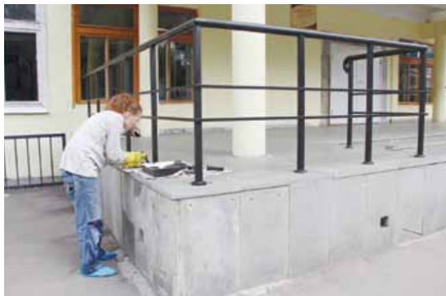
Последние штрихи - и «Здравствуй, школа!»

Шесть лет подряд педагоги Октябрьского района становятся лидерами по количеству полученных президентских грантов 6 человек в этом году.