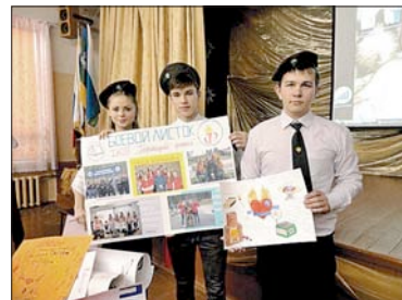
9-й районный «Слет дружин юных пожарных».