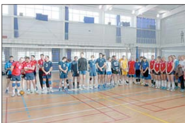
Розыгрыш Кубка начался с парада команд.