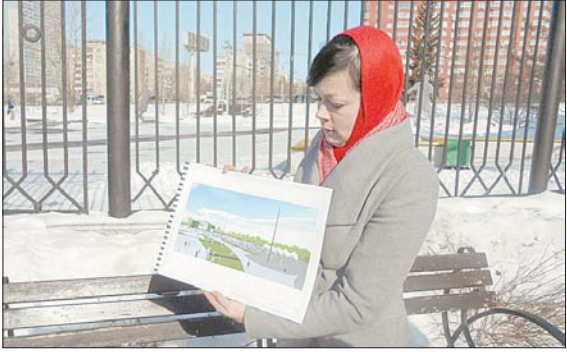
В апреле в ЦПКИО начнутся работы по созданию фан-зоны для болельщиков.

ПОЛТОРА ГЕКТАРА ЗАЙМЕТ ТЕРРИТОРИЯ ДЛЯ БОЛЕЛЬЩИКОВ В ЦПКИО