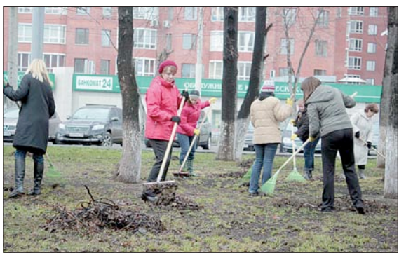
Субботник на Площади Обороны.

Глава администрации уральской столицы Александр ЯКОБ подписал постановление «Об организации санитарной уборки территории города Екатеринбурга в весенний период 2014 года». Проведение общегородского дня чистоты в этом году намечено на субботу, 19 апреля. Впрочем, дата может быть скорректирована с учетом погодных условий. Месячник чистоты продлится до 30 апреля.