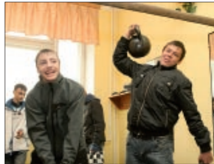
День призывника: старшекласники на традиционной экскурсии в артиллерийское командное училище.

Повестка на 25 марта — ждешь этого дня, как начала боевых действий. Проходишь медицинскую комиссию: по реакции врачей («Что, правда, пойдете служить?») не понимаешь, радоваться или нет тому, что здоровье отличное. Проходишь анкетирование на проверку возможности допуска к секретной информации. Получаешь повестку на самый смешной день в году — опять не понимаешь, смеяться или нет над первоапрельскими шутками. Стоя у дверей с надписью «Призывная комиссия», начинаешь почти физически ощущать единство мысли с такими же новобранцами справа и слева от тебя. Суета тех, кто еще только проходит медкомиссию, представляется незначительной — за порогом, кажется, начинается фронт. Нет, еще рано... После благодарных слов военкома проходишь тесты на профессиональное ориентирование — везде рекомендуешься. И снова повестка: живешь, отсчитываешь 15 дней. Правду говорят: «Неопределенность хуже войны». И вот — 16 апреля! Такое ощущение, что я действительно ДОЛЖЕН и