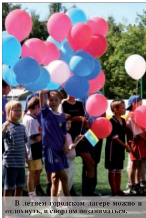
В летнем городском лагере можно и отдохнуть, и спортом позаниматься.

В прошлом году в загородном лагере «Каменный цветок» и в городских лагерях района отдохнуло около 19 тысяч детей от 6,5 до 15 лет. В этом году администрация района планирует принять не менее 15 тысяч ребят.