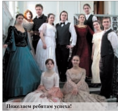
Пожелаем ребятам успеха!