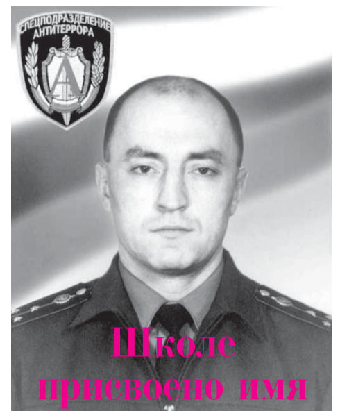
Школе присвоено имя