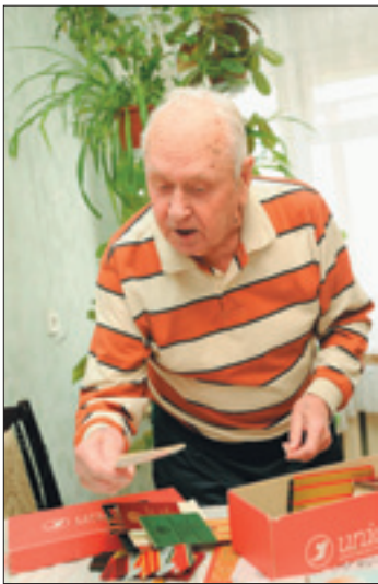
— А ребята знакомая с вами на улице здороваются?