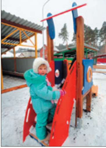
В Чапаевском проблема с детскими садами — закрыта.

— Неоднозначно. Реально это, конечно, повышение статуса. Но, если задуматься... Дело не-